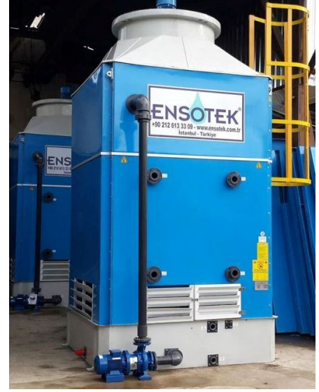
Görsel: Kapalı tip su soğutma kuleleri (closed circuit towers)