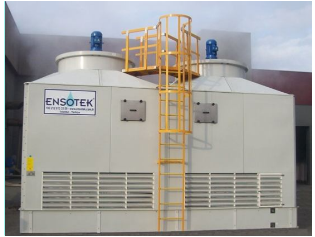
Görsel: Açık tip su soğutma kuleleri (open circuit towers)